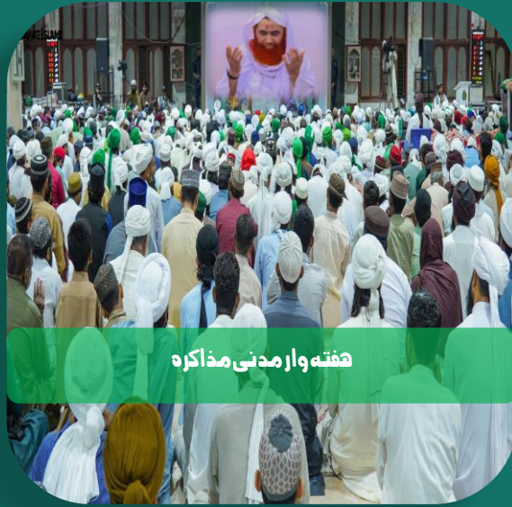
ہفتہ وار مدنی مذاکرہ